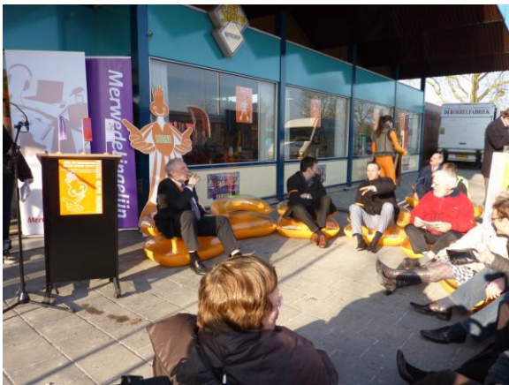
Onze burgervader laat het zich ook smaken