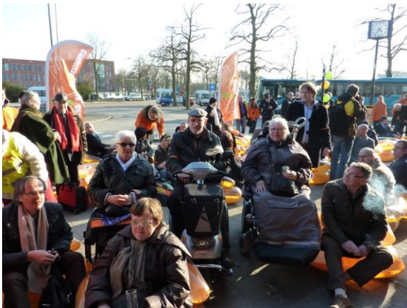
enkele Platformleden waren daarbij aanwezig

- Het Platform heeft mogen meepraten over de aanpassing van de buscarrousel bij het Stationsplein. Dit plein wordt herbestraat en geheel voorzien van geleidelijnen ten behoeve van mensen met een visuele beperking. Een aandachtspunt is om de elektronische busroute aanduiding te voorzien van spraaksysteem.