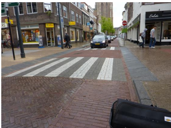
Lastige oversteek voor rolstoelers