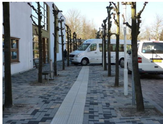
een goed voorbeeld, hoe bedoeld u?