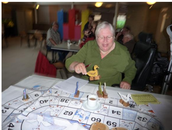
moeder de gans'

- Voor het schooljaar 2010-2011 is het thema 'voeding' gekozen. Hiervoor heeft het team versterking gekregen van een diëtiste van Rivas